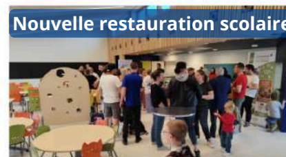
Nouvelle restauration scolaire