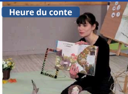
Heure du conte