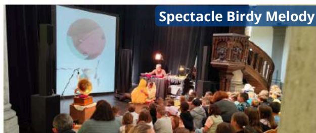
Spectacle Birdy Melody