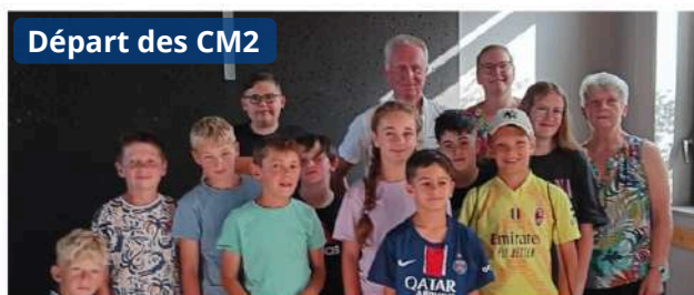
Départ des CM2