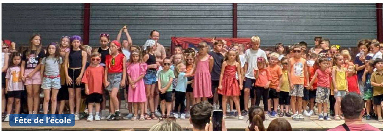
Fête de l'école