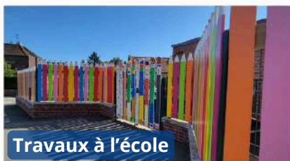
Travaux à l'école